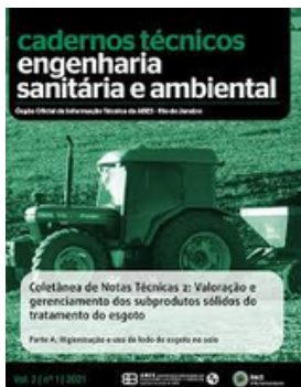
ABES BRASIL REVISTA ESA