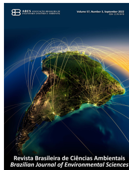
ABES BRASIL REVISTA DE CIÊNCIAS AMBIENTAIS