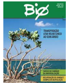
ABES BRASIL REVISTA DE BIO