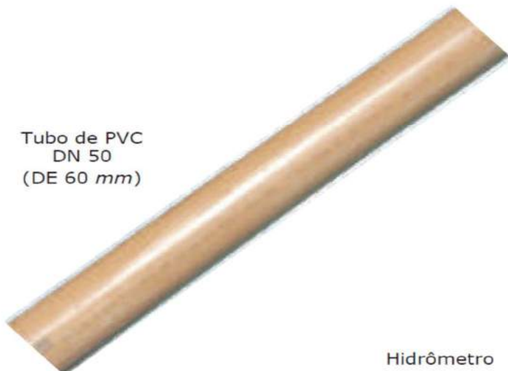
Tubo de PVC DN 50 (DE 60 mm)